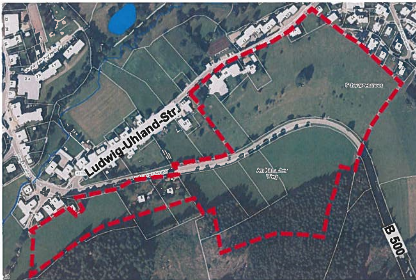
Änderungsbereich A „Ochsencamp“

Die 17. punktuelle Änderung des Flächennutzungsplans umfasst die Änderungsbereiche A „Ochsencamp“ und B „Sommerberg“ auf Gemarkung Schönwald. Änderungsbereich A (ca. 10,29 ha) befindet sich in Nordhanglage am südlichen Ortsrand der Gemeinde Schönwald und umfasst Flächen nördlich sowie südlich der B 500 / Furtwanger Straße. Änderungsbereich B (ca. 1,36 ha) befindet sich am nordwestlichen Siedlungsrand der Gemeinde Schönwald am Sommerberg. Im Süden grenzen Wohnbebauung, eine Schule und ein Kindergarten an. Die Änderungsbereiche sind in folgenden, nicht maßstäblichen Kartenausschnitten ersichtlich.