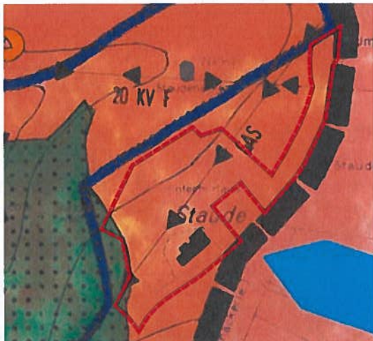
Änderungsbereich im wirksamen Flächennutzungsplan

Der Änderungsbereich befindet sich ca. 4 km nordöstlich von Triberg in exponierter Lage auf 900 m Höhe und ist umgeben von Wäldern und Feldern. Im Westen wird der Änderungsbereich durch Wald und im Norden durch landwirtschaftliche Flächen sowie Wiesenflächen begrenzt. Nordöstlich sowie südlich grenzt die Staudenstraße an das Gebiet an. Heute befinden sich im Änderungsbereich das Gasthaus Staude mit seinen Nebenanlagen, landwirtschaftliche Flächen sowie unbebaute Wiesenflächen. Der Geltungsbereich der Änderung beträgt etwa 1,37 ha und ist in den folgenden unmaßstäblichen Kartenausschnitten ersichtlich. Der Geltungsbereich wurde seit der Frühzeitigen Beteiligung aufgrund der Herausnahme von Waldflächen verkleinert. Im Einzelnen gilt die Planzeichnung (Deckblatt) vom 08.12.2025.