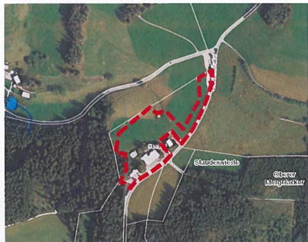
Änderungsbereich im Luftbild